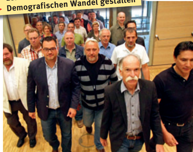
Jetzt geht's los: Die Tarifrunde kommt zusammen

Zu diesen guten Nachrichten gesellen sich aber auch schlechte: Die Rohstoffpreise explodieren, Eisenerz und Koks kohle sind um 50 bis 100 Prozent teurer geworden. Die drei marktbeherrschenden Bergbaukonzerne